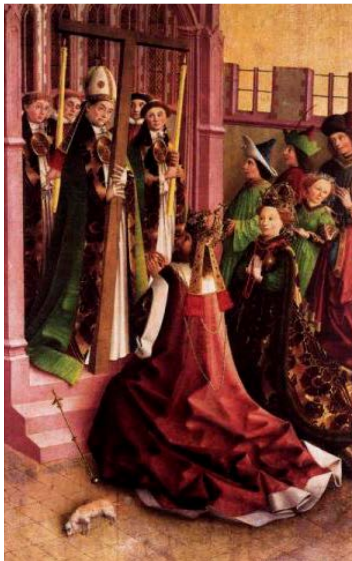
Ismeretlen német mester: Konstantin és Szent Ilona hódolata az igazi kereszt előtt (1440-es évek)

„A niceai zsinat idején Ilona, Konstantin édesanyja, ez a hitével és vallásosságával egészen egyedülálló asszony isteni intések alapján Jeruzsálembé ment és az ottaniak segítségével kereste a helyet, ahol Krisztus szent testét keresztre feszítették. A helyet azért nem volt könnyű megtalálni, mert az üldözések idején egy Vénusz-szobrot állítottak föl a Golgotán, hogy aki Krisztus tiszteletéért odamegy, úgy tűnjék, Vénuszt tiszteli. Ezért a keresztények elkerülték a helyet, s az már majdnem feledésbe merült. Amikor Ilona égi jel alapján rátalált a helyre, eltávolított onnan mindent, ami a pogány kultuszhoz tartozott, és a mélybe ásva (egy sziklaüregben) megtalálták a három keresztet. A megtalálás örömét csak az zavarta, hogy a keresztet nem lehetett egymástól megkülönböztetni. Ott volt ugyan külön Krisztus keresztjének felirata is, de nem lehetett meghatározni, melyik kereszthez tartozik. Az emberi tudatlanság isteni segítségre szorult.