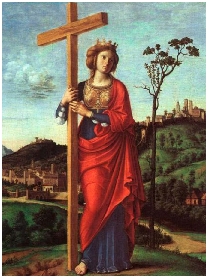
Cima da Conegliano: Szent Ilona (1495 körül)

A Szent Ambrus által szent emlékeztető nagyasszonynak nevezett Ilona 330 körül halt meg ismeretlen helyen. Testét Rómába vitték és a Via Labicana mentén egy kör alaprajzú mauzóleumban temették el. A római zarándokok az ő sírját is fölkeresték. Erekyeit az egyik hagyomány szerint a császár Konstanti-